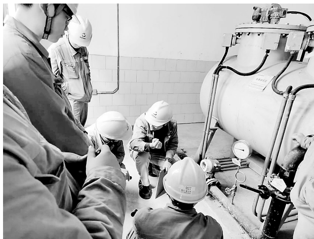
▲ 近日,晋南热电公司项目部举办员工年度常规培训考试,对员工今年安全知识与业务技能进行综合检验。图为现场培训考试。