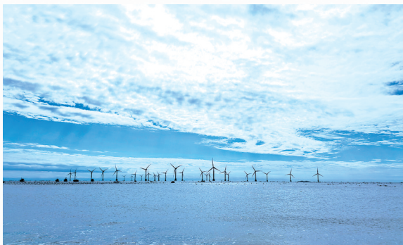
迎风向海的“大风车”