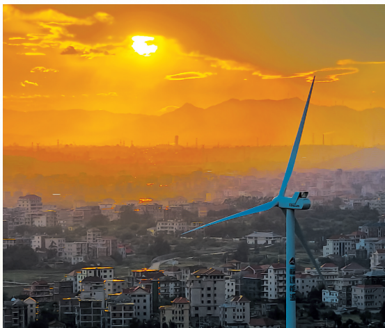
“大风车”在夕阳余晖下的浪漫