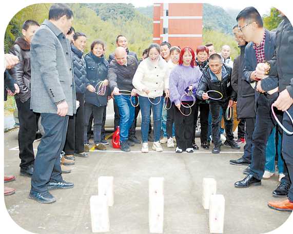
元宵佳节,永安煤业公司池坪芦坑煤矿开展了套圈取物、定点投篮、投壶、飞镖等系列文体活动,丰富了职工文化生活。