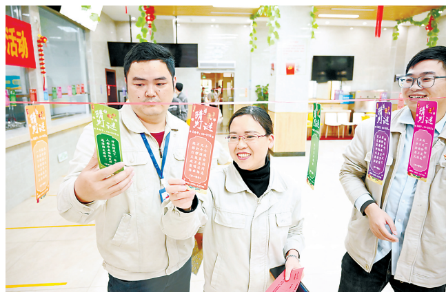
2月23日,石狮热电公司举办了“龙迎新春,喜庆元宵”职工趣味文体活动,营造了欢乐喜庆、温馨和谐的节日氛围。图为职工在猜灯谜。