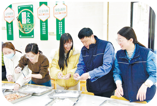
2月23日,为欢庆元宵佳节,东南电化公司举办了“欢乐庆元宵”活动。该公司员工齐聚一堂,滚元宵,包汤圆,欢声笑语、暖意浓浓。